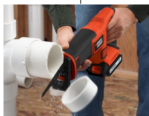
用途に合わせてシュー（金属板）の角度が調節できるピボッティングシュー機能