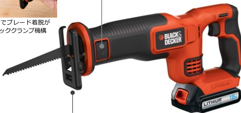
電動工具や園芸工具シリーズと共通の18Vリチウムイオンバッテリー