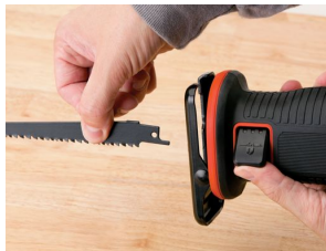
ワンタッチでブレード着脱が可能なクイッククランプ機構

※1 レシプロソー（reciprocating saw）は、先端のプレートが高速で往復運動することで切断する切断工具で、金属や厚みのある素材もスムーズに切断することができます。米国では一般家庭でのDIYリフォームからレスキューの現場まで幅広く使われています。