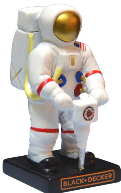
1971年のアポロ計画でNASA特注の月面掘削ドリルを持つ宇宙飛行士をモチーフにした、特製フィギュア（1/33スケール、高さ約5.5cm）